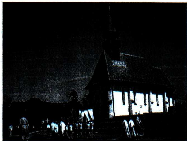
Templom búcsú 2000-ben