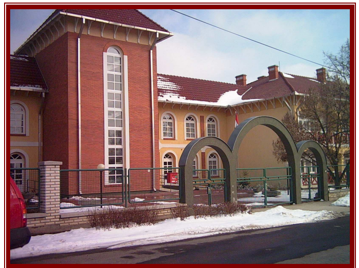
Idősek Otthonának bejárata, részlet.