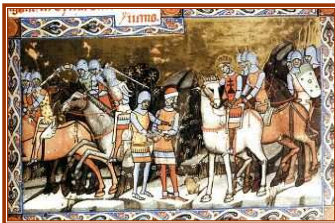
A Képes Krónika egyik illusztrációja: István király elfogatja Gyula erdélyi vezért 1002-ben.

István király 1038. augusztus 15-én halt meg Székesfehérvárott, ott is temették el. Népe három évig gyászolta: "A magyar paraszttársadalom, a nép a kenyérben saját munkájának gyümölcsét és Istennek áldott adományát érezte".